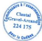
Clautal Gravel COMMISSAIRE À L'ASSERMENTATION